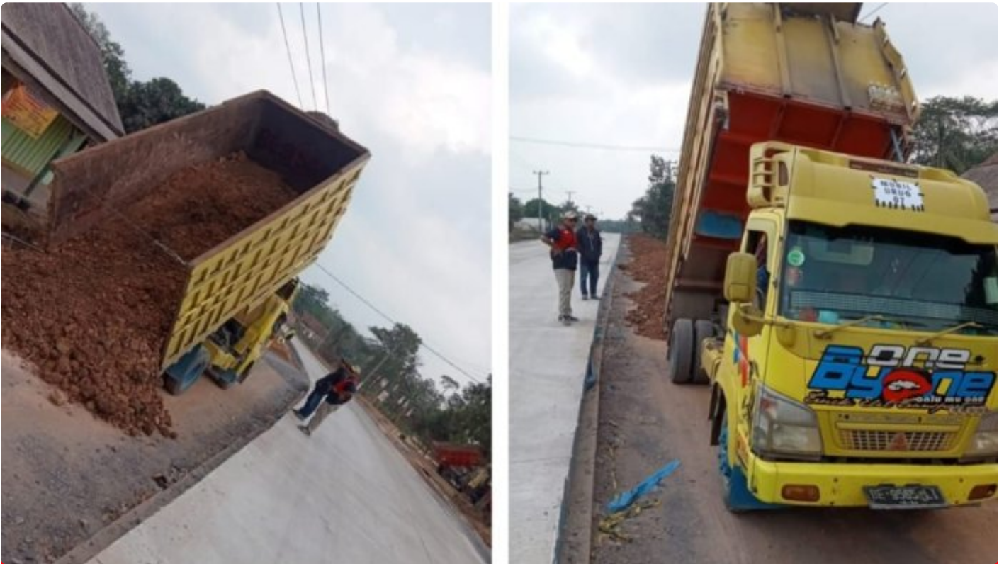
Mobil Pengangkut Tanah Galian C