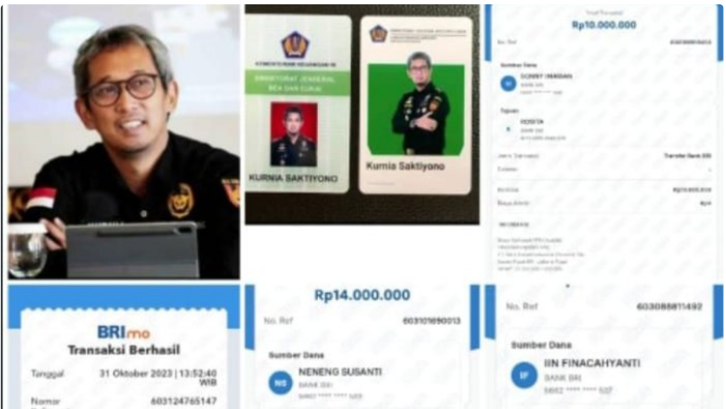
Bukti Screenshot Oknum Penipu yang Mengaku Pegawai Bea Cukai Bandara